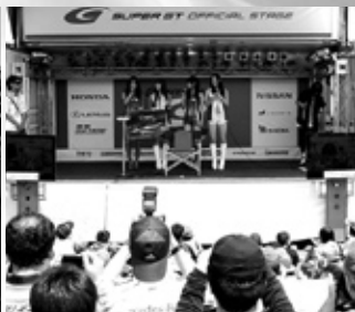
SUPER GTオフィシャルステージではさまざまな催しが華やか!