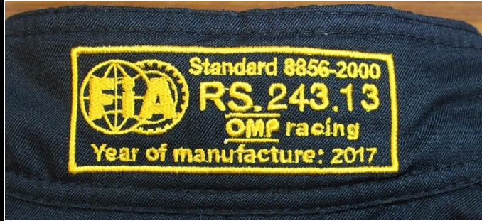
レーシングスーツの FIAラベルの写真